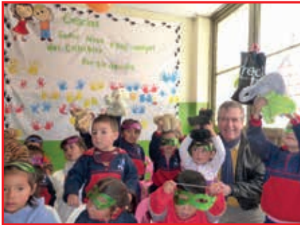
Los Pifufos sonrientes