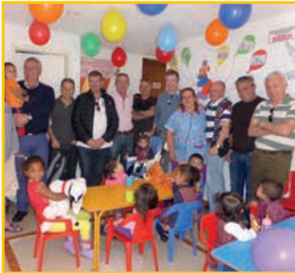
Mi Pequeño Refugio