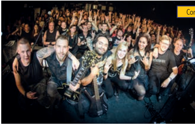
Concert Metal For Them au RKC – octobre