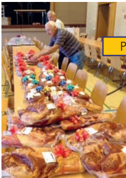
Préparation du loto – octobre