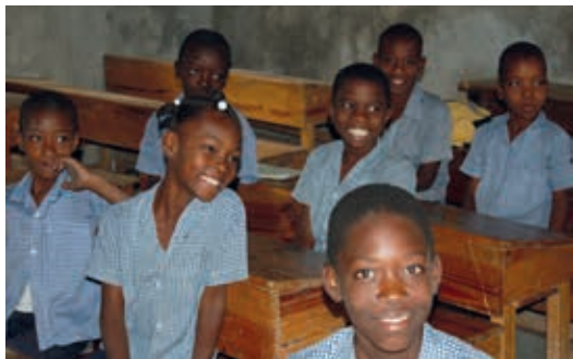
Elèves de l'école de Laval