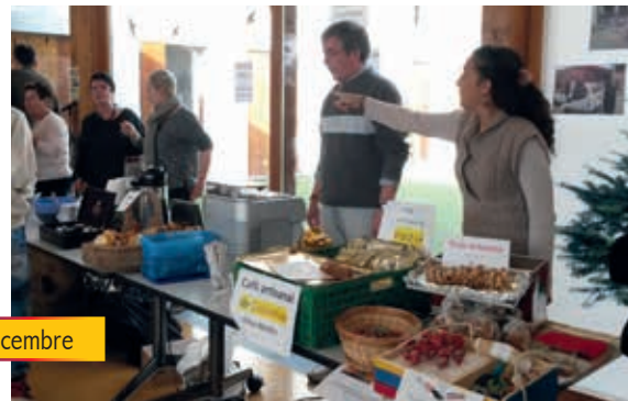
Marché de Noël – décembre