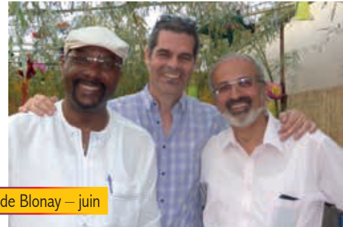
L'ambassadeur d'Haïti aux Fêtes de Blonay – juin